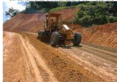
Cordonamento e miscelazione del materiale