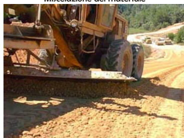
Miscelazione del materiale