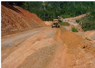
Rimozione materiale esistente